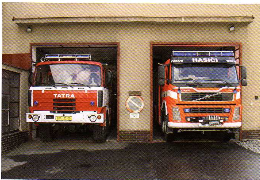
CAS 24/3200/500-S3Z Tatra 815