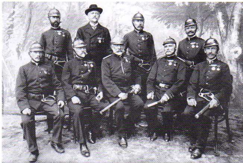
Zakládající členové sboru (1879)

V září roku 1879 měl sbor 116 členů činných a 21 přispívajících.