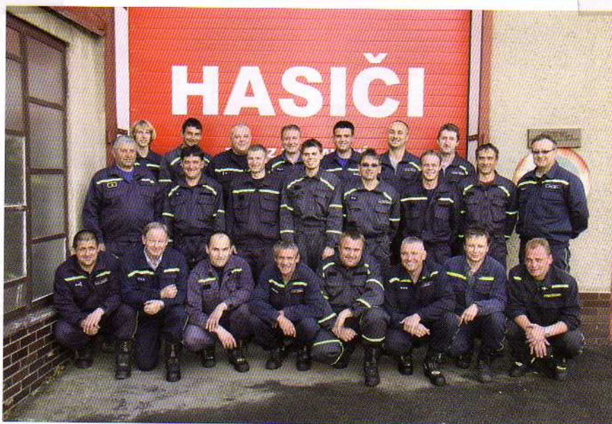
Členové zásahové jednotky (2009)