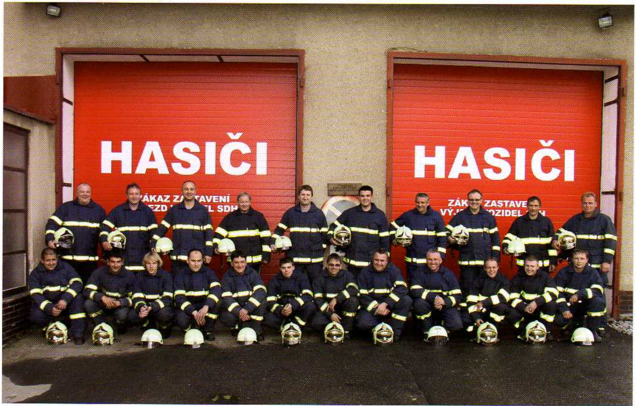
Zásahová jednotka SDH Nové Město na Moravě (2009)