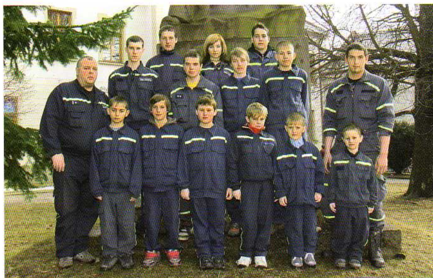
Kolektiv mladých hasičů (2009)