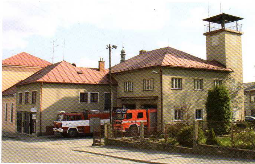
Hasičská zbrojnice (2009)